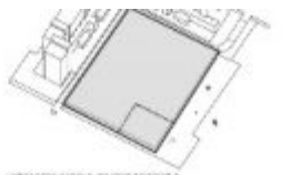
1. CONFORMITÀ E PIANIFICAZIONE