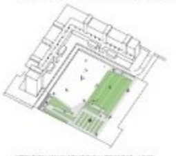
4. METI DI UN'ALTRA DIMENSIONE