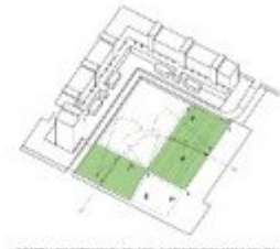
3. RICERCA DISCORDANZA